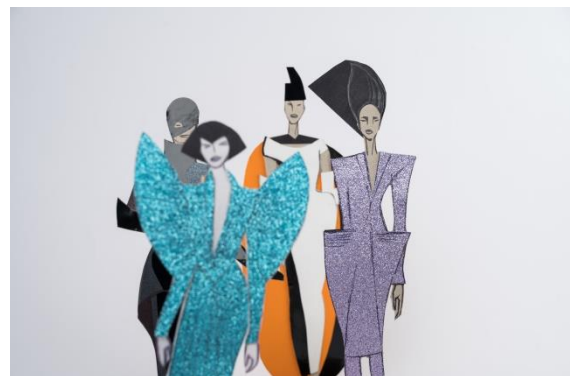
1. Graphic Notebook 2. Show Devant !